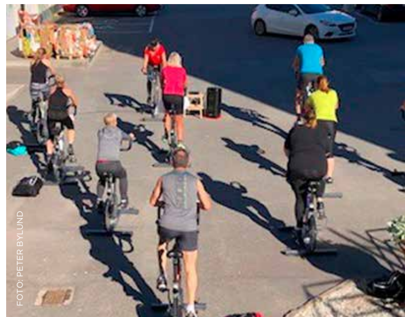
I sommar har flera av träningspassen flyttat utomhus.