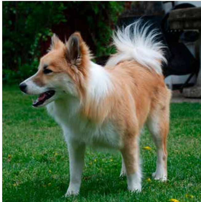
Toste är en isländsk fårhund som jobbar på Luddhund och älskar alla människor, speciellt de små, och är av uppfattningen att varje dag är en ny, fantastisk dag.

– En hund dömer inte, skvallrar inte, följer dig vart du går och älskar dig oavsett hur du mår, ser ut eller luktar. Vi behöver vara mer som våra hundar.