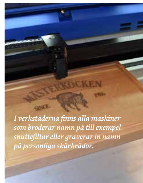
I verkstäderna finns alla maskiner som broderar namn på till exempel snuttefiltar eller graverar in namn på personliga skärbrädor.