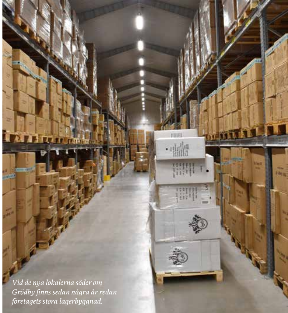
Vid de nya lokalerna söder om Grödbby finns sedan några år redan företaget stora lagerbyggnad.